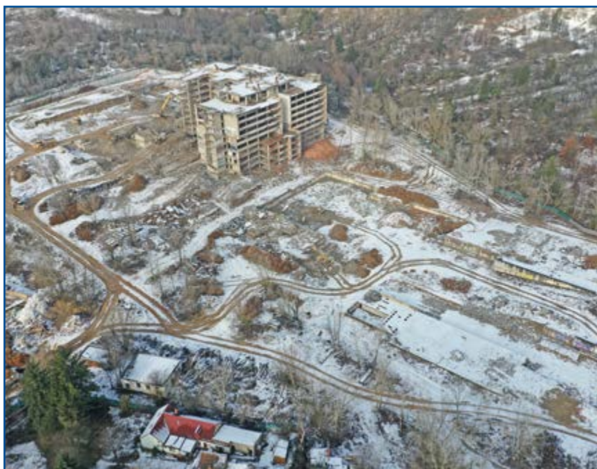
Pohľad na areál Rázsoch z dronu